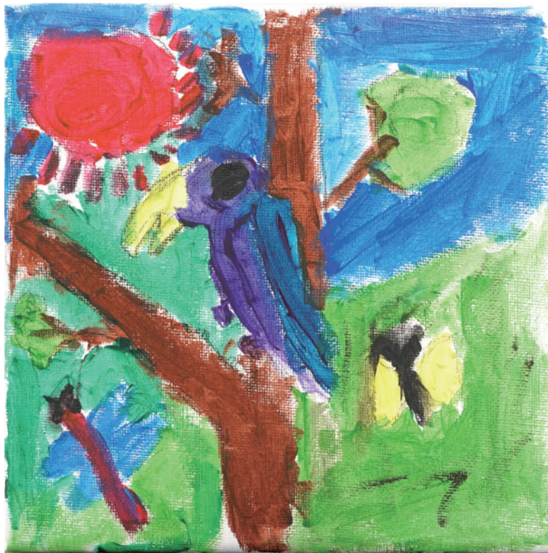
グリーンベルトの鳥

街をまもってくれている、日本橋消防署の消防車。勇ましく堂々としてカッコイイのだけれど、出陣を待つ間はだれか一緒にいてくれたら楽しそうだな。大きな水槽を互いにつかず離れず自由に泳ぎ回るエイやコバンザメがそばにいたらいいな。住むところも食べるものも、何もかも違うけれど、それでも当たり前のように一緒に暮らせるこんな世界があったら面白いよね、という思いを込めて描きました。