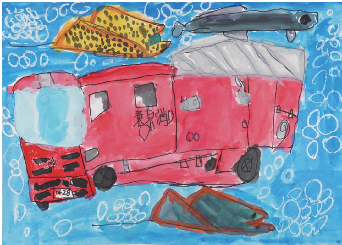
しょうぼうしゃとエイのであい