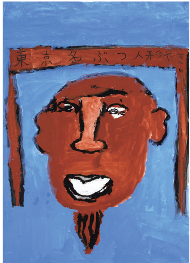
いたくらやの人形やき

白鳥の絵を書いたりゆうは白鳥がカップルになってなかよくしているところを書きたかったからです。くふうしたところは太陽が湖にうつっているところです。