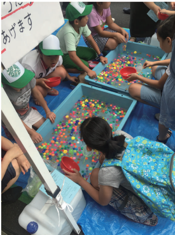
子どもをもって子どもを制す 4

末廣神社の玉垣をよく見ると、ここ人形町が誇る名店の名がずらり。まさに、風格漂う玉垣。