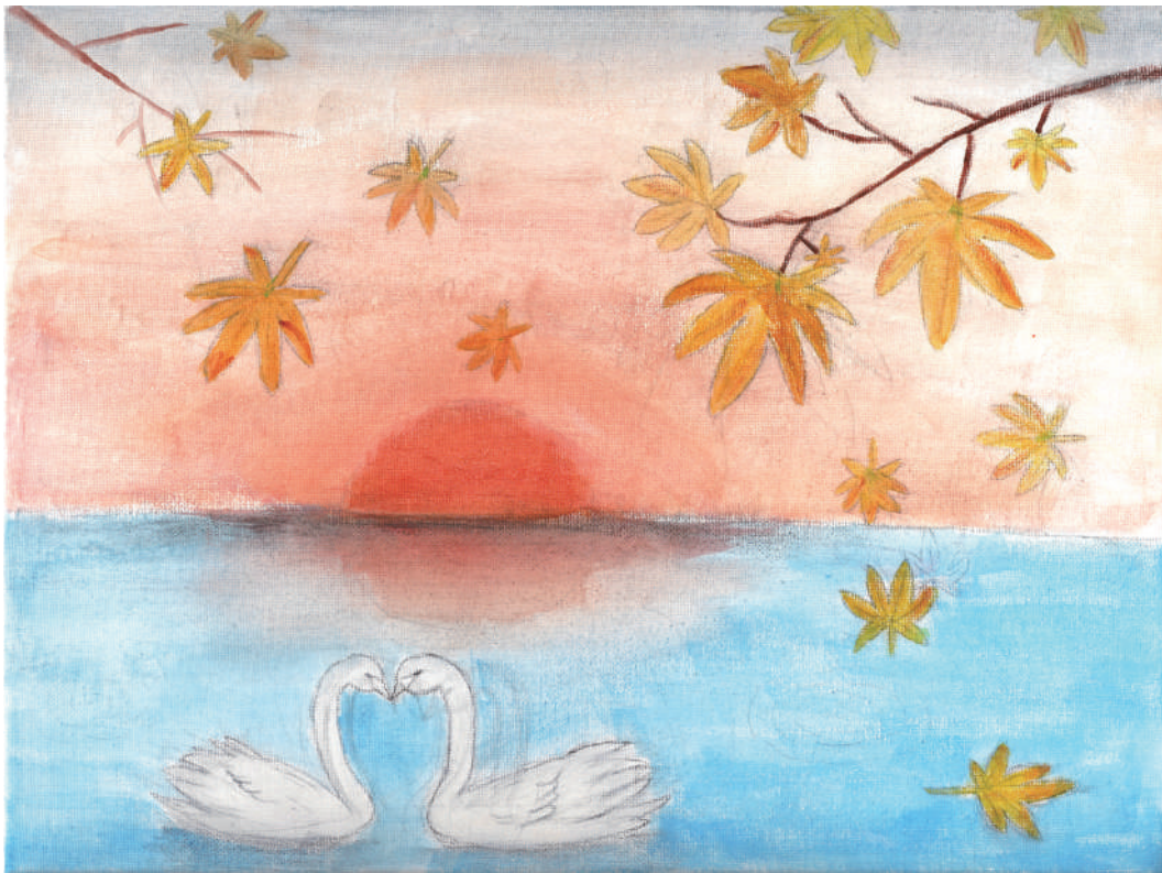
夕日にかがやく湖